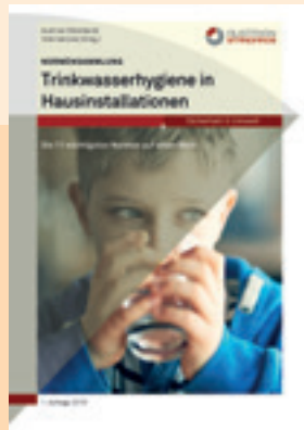
Austrian Standards International (Hrsg.) Normensammlung Trinkwasserhygiene in Hausinstallationen – Die 11 wichtigsten Normen auf einen Blick; 1. Auflage 2019 ISBN: 978-3-85402-384-5

Je nach Gebäudetyp (z.B. Wohnhaus bis Krankenhaus und Pflegeheim) gibt es unterschiedliche normative Anforderungen sowohl an die Planung und technische Ausführung der Verbrauchsanlage als auch den bestimmungsgemäßen Betrieb und die Wartung, um das gemeinsame Schutzziel – nämlich die Trinkwasserqualität – nicht zu beeinträchtigen. Damit alle für die Planung, Errichtung, den Betrieb und die Sanierung von Trinkwasserinstallationen Verantwortlichen die wich-