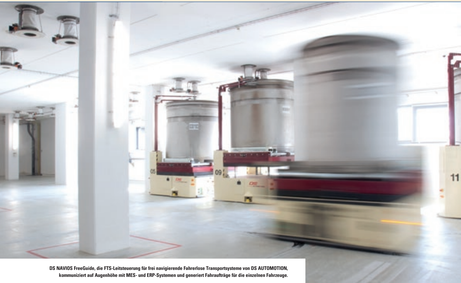
DS NAVIOS FreeGuide, die FTS-Leitsteuerung für frei navigierende Fahrerlose Transportsysteme von DS AUTOMOTION, kommuniziert auf Augenhöhe mit MES- und ERP-Systemen und generiert Fahraufträge für die einzelnen Fahrzeuge.