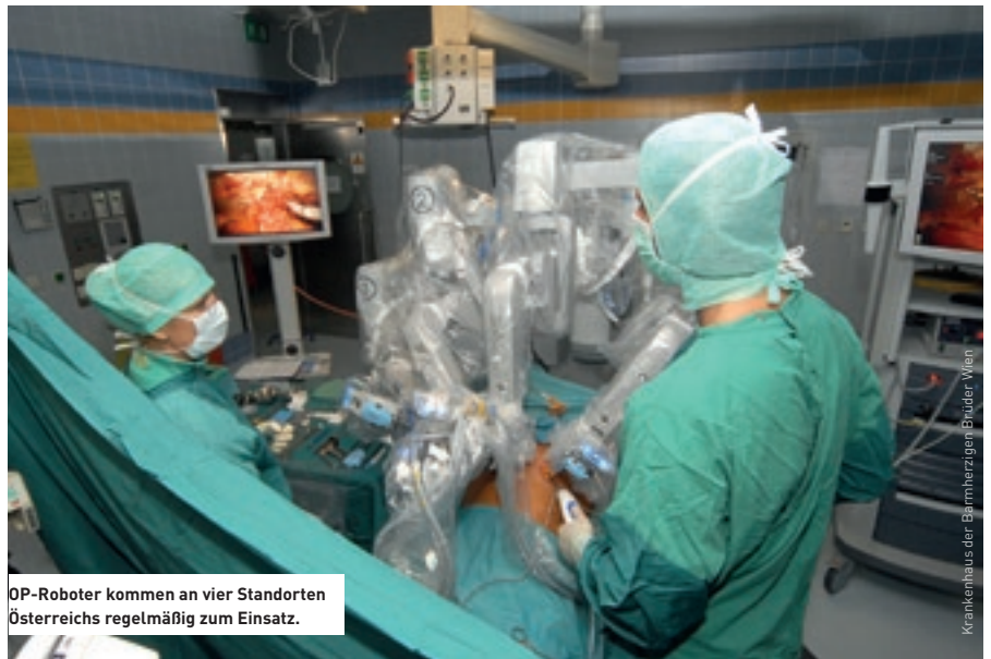
OP-Roboter kommen an vier Standorten Österreichs regelmäßig zum Einsatz.

Krankenhaus der Barmherzigen Brüder Wien