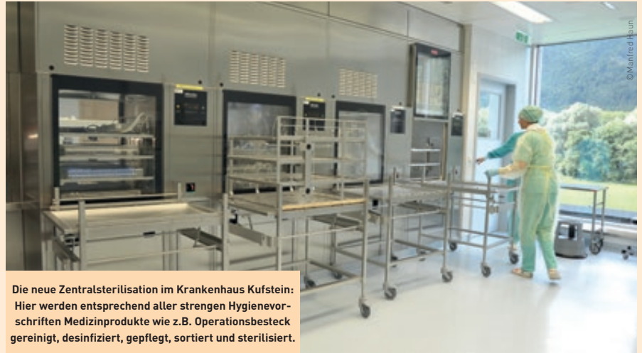
Die neue Zentralsterilisation im Krankenhaus Kufstein: Hier werden entsprechend aller strengen Hygienevorschriften Medizinprodukte wie z.B. Operationsbesteck gereinigt, desinfiziert, gepflegt, sortiert und sterilisiert.