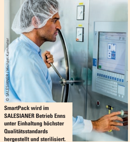
SmartPack wird im SALESIANER Betrieb Enns unter Einhaltung höchster Qualitätsstandards hergestellt und sterilisiert.

Da die Sets bereits einen Großteil der für die OP benötigten Einzelkomponenten enthalten, wird die Rüst- und OP-Vorbereitungszeit deutlich reduziert. Das schafft insbesondere bei