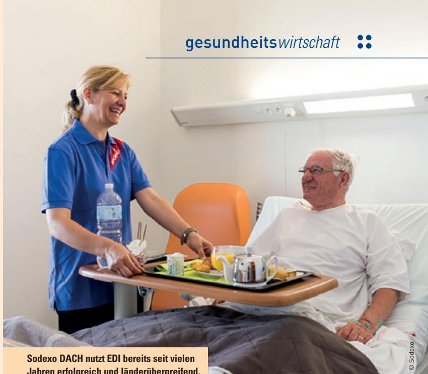
Sodexo DACH nutzt EDI bereits seit vielen Jahren erfolgreich und länderübergreifend.

Impressum nach § 24 MedienG: Medieninhaber: Schaffler Verlag GmbH, A-8041 Graz, Kasernstraße 80/8/25, T: +43 (0)316 820565-0, F: +43 (0)316 820565-20, E: office@schaffler-verlag.com, Web: www.schaffler-verlag.com. Druck: Dorrong, Graz. Chefredakteurin: Elisabeth Tschachler-Roth, tschachler@schaffler-verlag.com, am Standort Redaktion Wien: Lorenz-Bayer-Platz 16/23, A-1170 Wien. Herausgeber: Mag. Roland Schaffler, roland@schaffler-verlag.com, am Standort Redaktion Graz: Kasernstraße 80/8/25, A-8041 Graz. Weitere Informationen und Offenlegung nach § 25 MedienG: www.schaffler-verlag.com → „Impressum“. Datenschutzerklärung: www.schaffler-verlag.com/datenschutzerklaerung