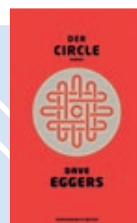
Dave Eggers: Der Circle. Roman. Kiepenheuer & Witsch, Köln 2014. ISBN: 978-3-4620-4675-5.