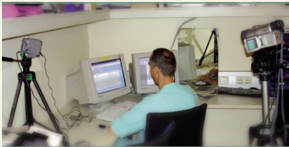
Typisches Setting während eines Usability-Tests: Mit zwei Kameras und einem Spiegel werden Hand-Auge-Koordination, Gesichtsausdruck und Blickbewegungen aufgenommen, während die Testperson alles „laut ausspricht“, was ihr während der Ausführung einer Aufgabe durch ihren Kopf geht.

Abweichungen gleichzeitig gut übersichtlich und erkennbar darstellen können.