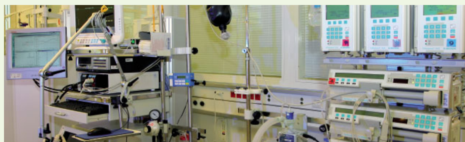
Gerade für den Einkauf in Krankenhäusern entscheidend: Know-how im Bereich Medizinproduktegesetz und EU-Richtlinien.