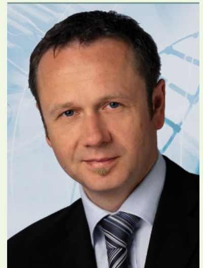
Einsteigen und aufsteigen. Der Gesundheits-Cluster setzt auf den neuen Lehrgang „Medizinprodukte“. Start im März 2006.

In weiterführenden Modulen wird das Qualitätsverständnis aus den Blickwinkeln Entwicklung, Herstellung und Vertrieb vertieft. Dabei werden zum Beispiel der Designprozess, grundlegende Anforderungen an die CE-Kennzeichnung, Zulassungsverfahren, technische Dokumentation, Kennzeichnung, Rückverfolgbarkeit und